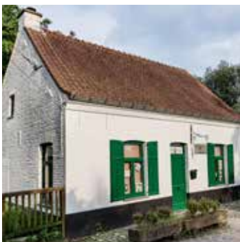
Blijft het 'Streekpunt Zwalm' open voor fietsers en wandelaars?